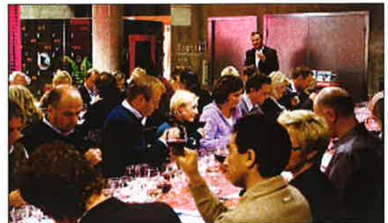
Lærerikt: Vinsmakingen koblet til matretter ble en spennende seanse for rundt 50 deltagere på Thor Heyerdahl videregående torsdag kveld.